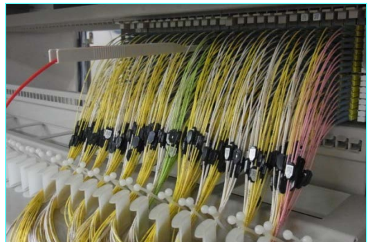
使用例:) MUコネクタの試験状況