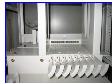
▲スプリッタ搭載部拡大